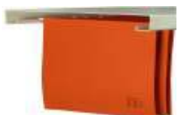
Art.-Nr.41025 Fachboden für Hängeregister (Hängeregister unter FB links + rechts einhängbar)