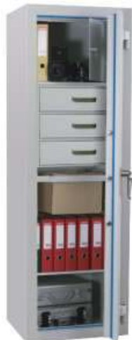
Art.40707mit Art.40724 und Art.40726 sowie 3 x Art.40741

Grundausstattung: DB-Schloss VdS Klasse 1 mit 2 Schlüsseln (Länge 120mm), Hängegriff metall 60mm vorstehend, Riegelwerk, Türöffnungswinkel 180°, 2 Bohrungen im Boden (Schrank muss verankert werden), Türanschlag rechts bei eintürigen Modellen standard (Türanschlag links bei eintürigen Modellen auf Wunsch ohne Mehrpreis), Lackierung RAL 7035