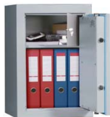
Art.-Nr. 40703 mit Art.-Nr. 40723 gg. Mehrpreis