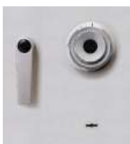
Hängegriff DB Metall und ZK-Schloss standard