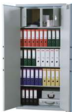
Art. 38109 + Art. 38125

30 Minuten Feuerschutz für Papier bis ca. 840°C durch Spezialfüllung in den Wandungen und spez. Dichtungen. Feuerschutz LFS 30P nach Euro-Norm