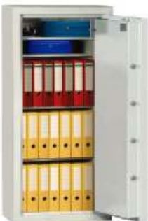
Art. 41006 mit Art. 41023 gg. Aufpreis

Versicherungsschutz durch definierte Einbruchprüfung nach VdS 2450/EN 1143-1 Klasse 1, privat bis Ä 65.000,-; gewerblich bis Ä 20.000,- (Unverbindliche Richtwerte, sprechen Sie mit Ihrer Versicherung.) Der Einbau von EMA-Komponenten (doppelte Versicherungssumme) ist gg. Mehrpreis möglich. (bei fach- und sachgemäßer Verankerung gem. beigefügter Anleitung) Zertifiziert und güteüberwacht durch VdS-Zert in Köln. Allseitig mehrwandiger Korpus. Tür mehrwandig 104mm stark. Die mehrwandige Konstruktion garantiert einen definierten Einbruchschutz gegen Angriffe mit mechanischen und thermisch wirkenden Einbruchwerkzeugen. (Einbruchschutz 30/50 RU). Serienmäßige Verankerung am Boden ist vorbereitet. Die Verriegelung erfolgt über ein DB-Schloss der Schlossklasse I. (incl. zwei Schlüsseln). Beschläge u. Scharniere 60mm vorst. Grundausrüstung: DB-Schloss VdS Klasse 1 mit 2 Schlüsseln (Länge 120mm), Hängegriff metall 60mm vorstehend, mit Riegelwerk, aussenliegende Bänder, Türöffnungswinkel 180°, Türanschlag rechts (Türanschlag links auf Wunsch ohne Mehrpreis), 1 Bohrung im Boden, Lackierung/Farbe: RAL 7035