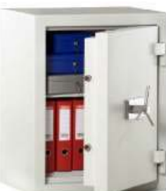
Art.-Nr. 42502 (Sterngriff Metall auf Anfrage gg. Mehrpr.)