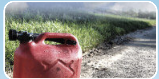
Schon wieder nachtanken?